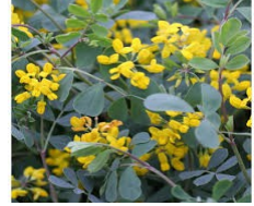
Coronilla valentina Coronille (IV-V)