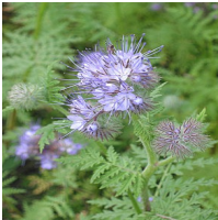
Phacelia tanacetifolia Phacélie (IX-X)