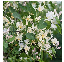
Lonicera fragrantissima Chèvrefeuille arbustif (I-II)