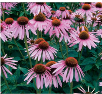
Echinacea purpurea Echinacée (VI-VII)