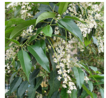
Prunus lusitanica Laurier du Portugal (V-VI)