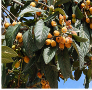
Mespilus germanica Néflier commun (XI-XII)