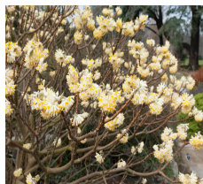
Edgeworthia chrysantha (I-II)