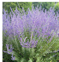
Perovskia atriplicifolia (VIII-IX)