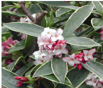
Daphne odorata Daphné (II-III)