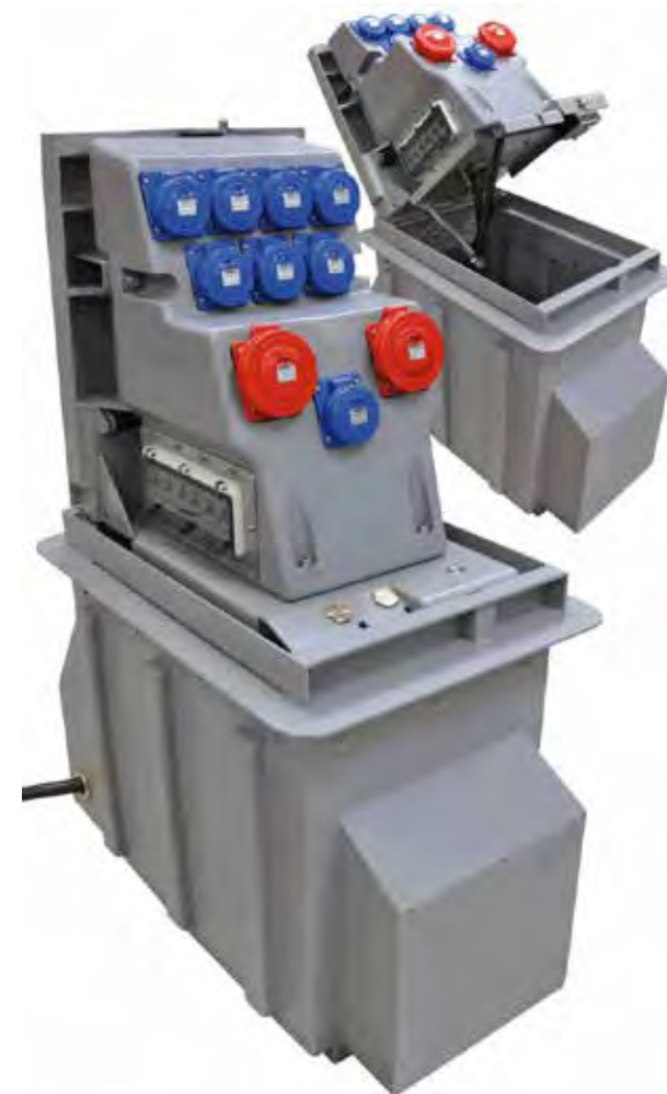
Borne électrique escamotable