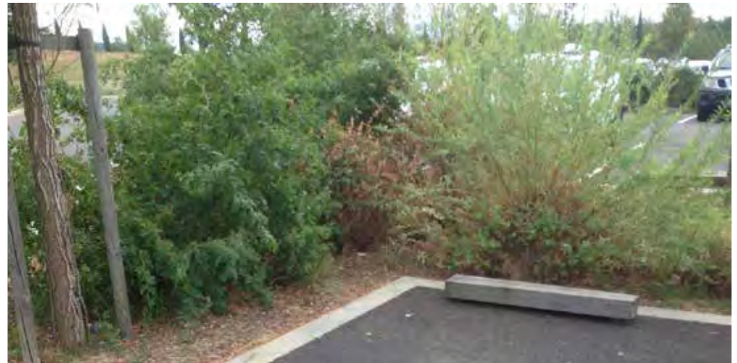
Madrier bois sur pieds galvanisés