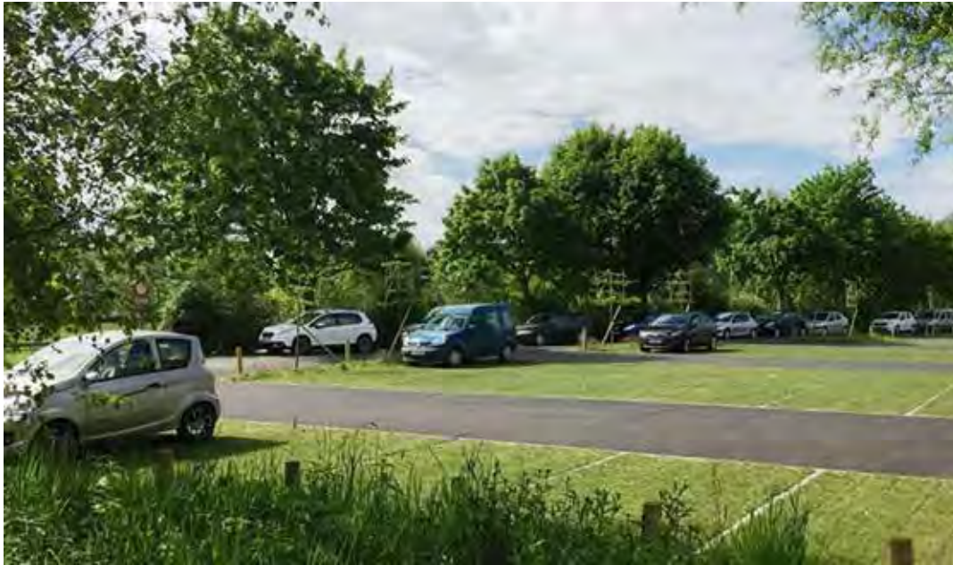
Structure alvéolaire engazonnée