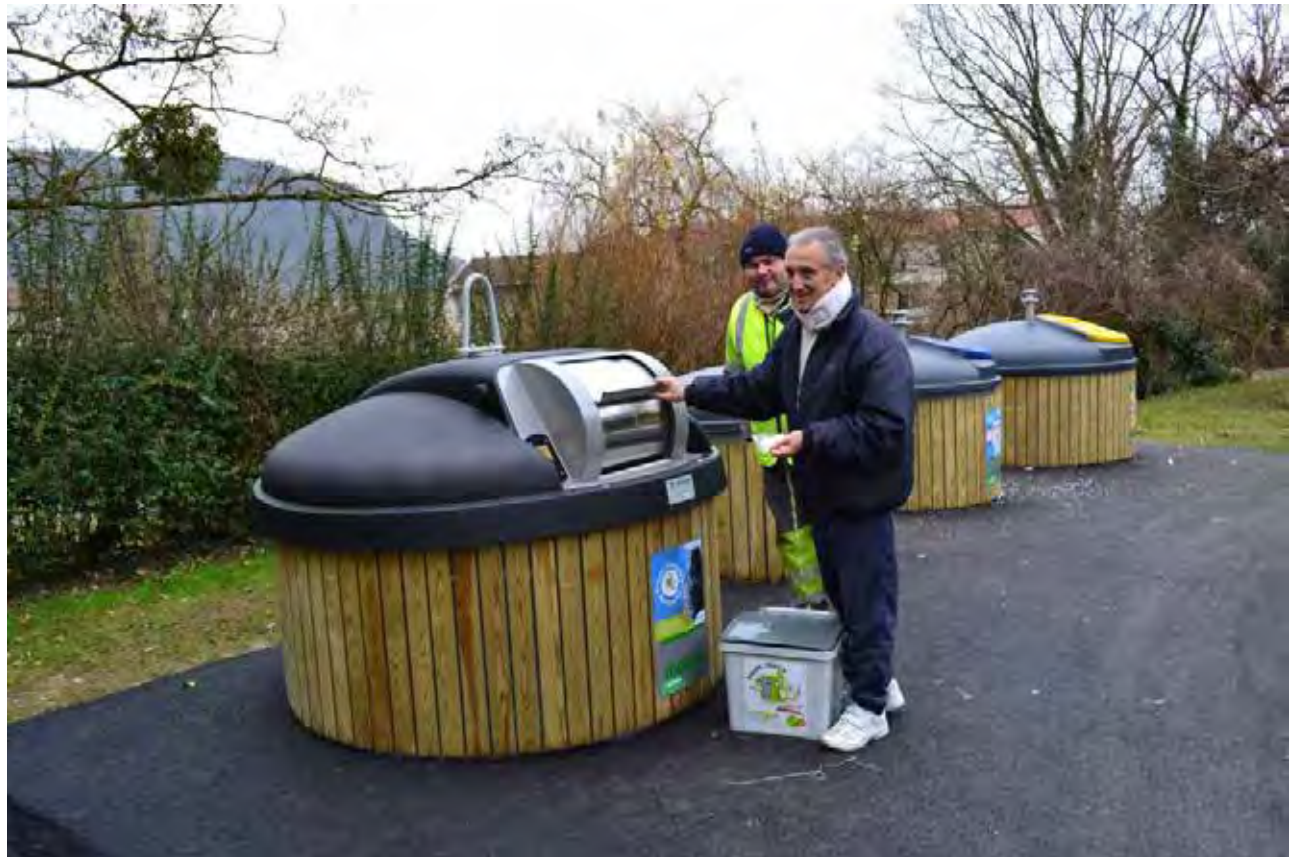
Containers de poubelles entérés