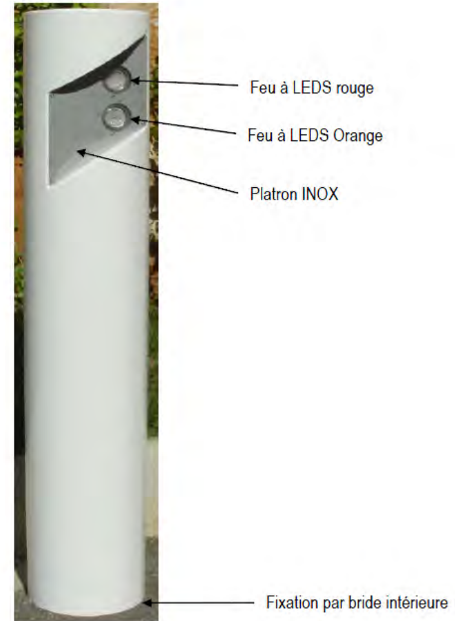
Borne escamotable et tableau de commande