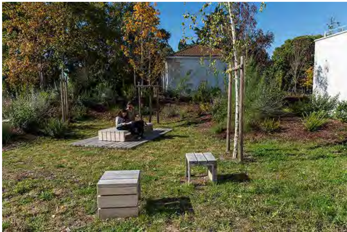
Gamme Link par Sineu Graff